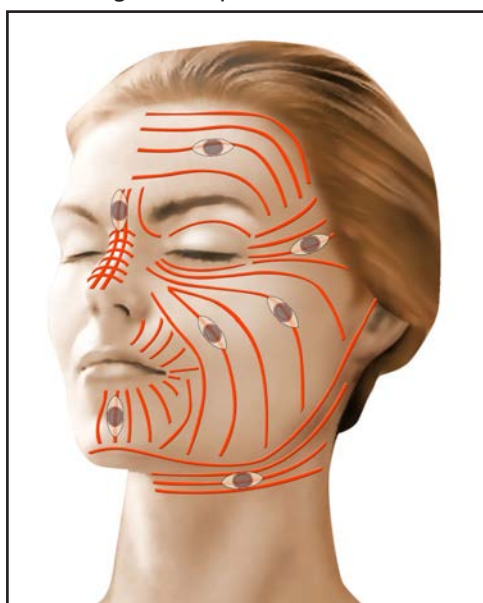
lignes de moindre tension de la face - orientation optimale des fuseaux d'excision

Souvent, il est nécessaire d'avoir recours à un tracé d'incision spécial visant à « briser » l'axe principal de la cicatrice initiale, à réorienter au mieux la cicatrice en fonction des lignes de tension naturelles de la peau, et à diminuer ainsi la tension exercée sur les berges de la plaie.